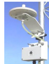
プレッシャーポート CYG-61002