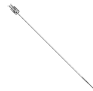
支持、コネクタ付き極細センサー