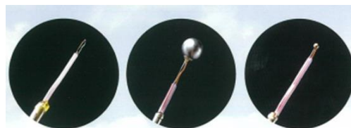
放射の影響を補正するための 3 つの小さな球

本製品は農研機構が取得した特許(特許番号 6112518)を許諾を受けて利用しております。